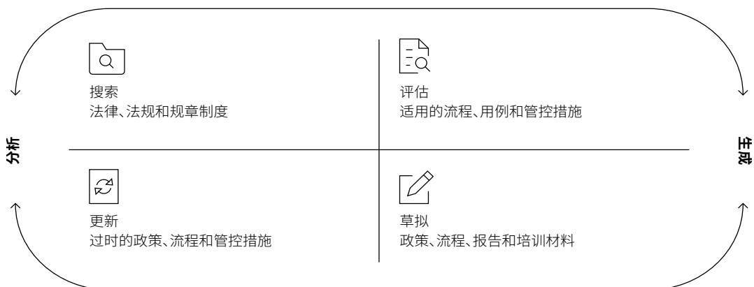
图1: AI语言工具在合规领域的用途

分析: AI语言工具可以总结大量开放式文本信息, 并根据观察到的惯例或用户输入要求将这些信息整合成报告。AI语言工具如果想要在合规方面实现这种用法还存在一个问题, 那就是分享到AI语言工具的机密信息都会被收集到数据集中。