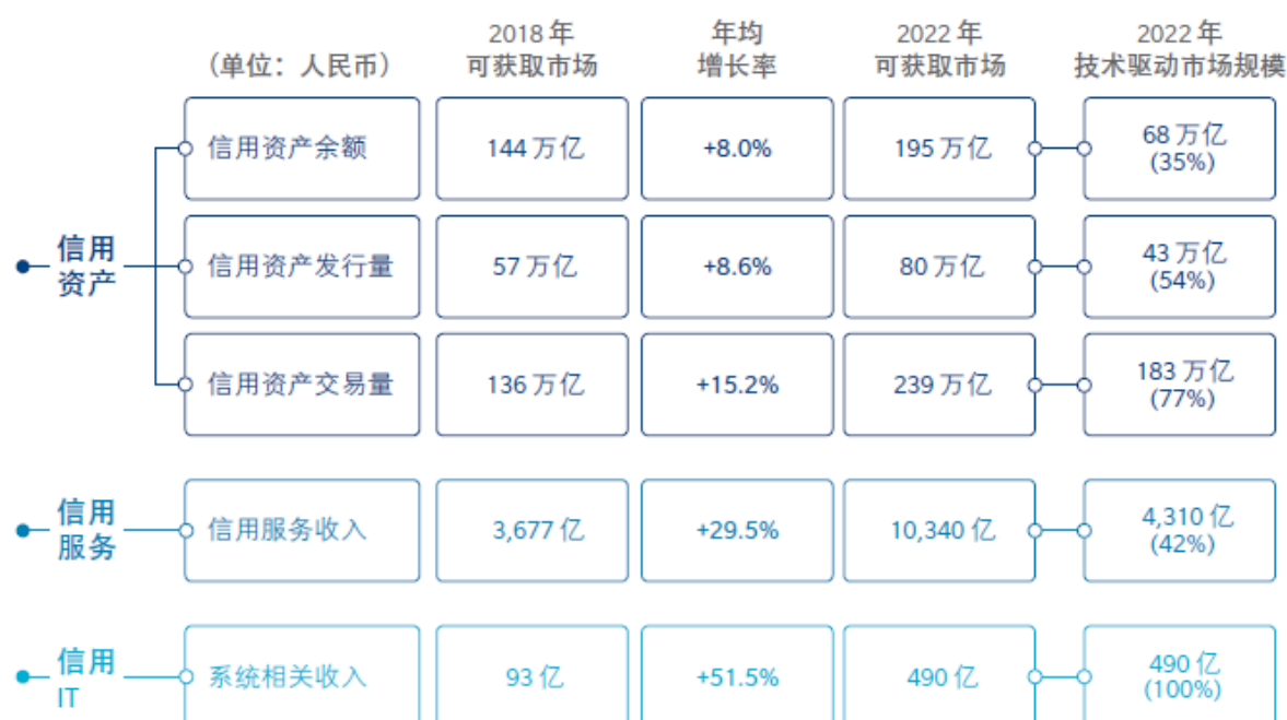
圖表 1：中國信用市場格局及信用科技市場規模

此報告以「科技賦能信用，信用產生價值」為主題並指出，受益於信用科技的持續創新，信用市場下的三層細分市場（信用資產、信用服務以及信用 IT）將在未來五年迎來重大發展機遇。