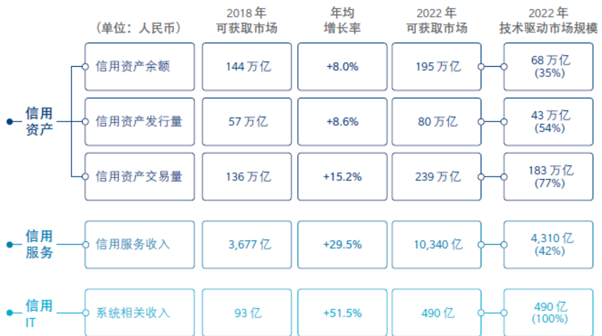
图表 1：中国信用市场格局及信用科技市场规模

此报告以“科技赋能信用，信用产生价值”为主题并指出，受益于信用科技的持续创新，信用市场下的三层细分市场（信用资产、信用服务以及信用 IT）将在未来五年迎来重大发展机遇。